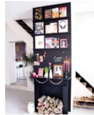
Exposé page 112