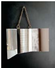
Triptyque page 96