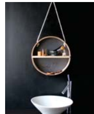
Tamis page 142