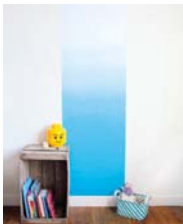
Tie & dye page 44