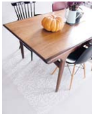
Trompe-l'œil page 78