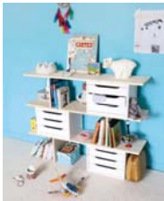
Superposé page 18