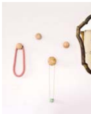
Patères page 106