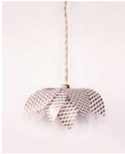
Lotus page 8