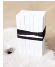
Ceinturé page 132