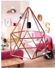
Cuivré page 66