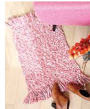
Tressé page 122