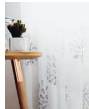
Dahlia page 152