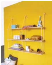
Balançoire page 86