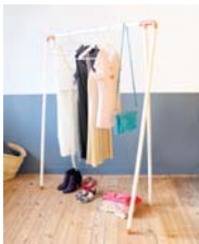
Factory page 32