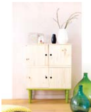
Cubik page 54