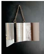
Triptyque page 96