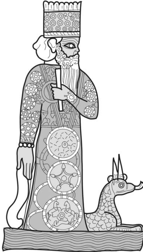
Marduk, dieu de Babylone.

Marduk agace Tiamat en s'amusant avec les quatre vents, un « cadeau » offert par son père. À son tour, Tiamat veut se débarrasser des dieux et de Marduk. Elle fait appel à Kingu pour les tuer et lui remet la tablette des destins. Elle crée une armée de créatures monstrueuses, hommes scorpions, monstres marins, lions géants, etc. et les envoie au combat. An va quérir Anu et Ea pour combattre les créatures de Tiamat, mais aucun n'ose s'aventurer. Seul Marduk accepte de se rendre au combat, à la condition toutefois qu'on lui transfère le pouvoir de fixer les destins, et voici Marduk partant à l'assaut aidé des vents et de la tempête. Il déploie un immense filet et attrape les monstres ainsi que Tiamat. Marduk tue Kingu, lui reprend la tablette aux destins et fait souffler les vents dans la bouche de Tiamat : une fois son ventre gonflé comme une outre, il tire une flèche qui la transperce.