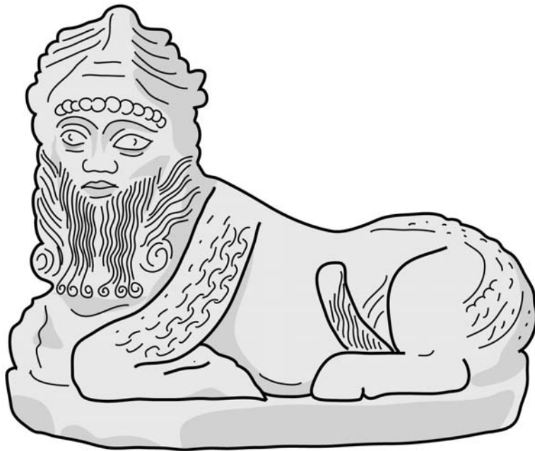
Taureau androcéphale d'Assyrie, symbole de puissance.

Symbole de puissance. Le dieu de la lune d'Ur est assimilé à un taureau céleste. En Assyrie, des taureaux androcéphales font office de gardiens et de protecteurs des portes des villes. Ils ont un corps de taureau, un visage humain et des ailes. Ils appartiennent à l'art assyrien du I er millénaire avant notre ère.